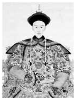
그림 속 인물은 청의 광서제이다. 그는 어린 나이에 황제로 즉위하였다. 1885년에 청프 전쟁에서 패배하여 베트남에 대한 종주권을 상실하였다. 1898년에는 메이지 유신을 모범으로 삼자는 Kangyuei의 상주를 받아들여 체제 개혁에 대한 조서를 반포하였다.